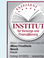
Klassik Klassik Stand: 07/2016

Zukunftssicherer Partner – für eine langfristige Vorsorge brauchen Sie einen zukunftssicheren Partner. Anerkannte Ratingagenturen zeichnen die Allianz Lebensversicherungs-AG regelmäßig mit Bestnoten für Qualität, Finanzkraft und Sicherheit aus.