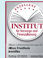
InvestFlex Stand: 07/2016