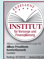
KomfortDynamik Comfort Stand: 07/2016

Produktqualität – unabhängige Ratingagenturen zeichnen unsere Produkte regelmäßig mit Bestnoten aus.