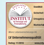
LV Unternehmens- qualität Stand: 11/2016