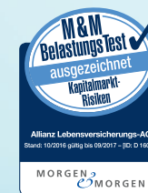
BelastungsTest Stand: 10/2016; ID: D 16012