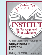
IndexSelect Index Stand: 07/2016