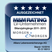
Bilanzjahrgänge 2011–2015 Stand: 10/2016; ID: D 16013

Zukunftssicherer Partner – für eine langfristige Vorsorge brauchen Sie einen zukunftssicheren Partner. Anerkannte Ratingagenturen zeichnen die Allianz Lebensversicherungs-AG regelmäßig mit Bestnoten für Qualität, Finanzkraft und Sicherheit aus.