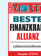
Beste Finanzkraft Allianz Ausgabe: 15/2016